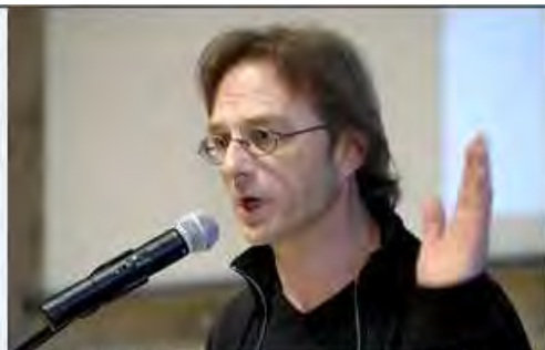
Kabarettist Fritz Eckenga sorgte für unterhaltsame Momente während der Preisverleihung.

Das Auszeichnungsverfahren "Lebendige Nachbarschaften – Das gute Quartier" wurde im Rahmen der Aktionsplattform "NRW wohnt" ausgelobt, mit der sich die Architektenkammer Nordrhein-Westfalen seit Ende 2007 dafür einsetzt, öffentliche Diskussionen und einen lebhaften Austausch über das Themenfeld "Wohnen und Leben" zu initiieren und zu befördern. Auf dezentralen Diskussions- und Präsentationsveranstaltungen sowie im Rahmen von Preisverfahren kommen Fachleute und Laien, Bürger und Vertreter aus Politik und Verwaltung miteinander ins Gespräch.