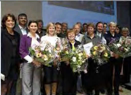
Die Preisträger des Auszeichnungsverfahrens "Lebendige Nachbarschaften"

Es gehe darum, das Zusammenleben zu verbessern, soziale Kontakte zu fördern und den Menschen die Teilhabe am gesellschaftlichen Leben zu ermöglichen. Diese Ziele verfolge das Bauministerium auch mit dem erfolgreichen Programm "Soziale Stadt". Es sei wichtig, das Eigenengagement der Menschen zu stärken: "Wir brauchen Beteiligungsstrukturen und Ideen, wir brauchen ein Umdenken von einer passiven Erwartungshaltung hin zu einem aktiven Mittun", betonte der nordrhein-westfälische Minister für Bauen und Verkehr.