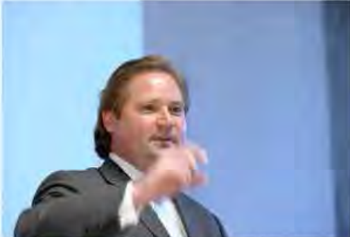
Lutz Lienenkämper, Minister für Bauen und Verkehr des Landes NRW

Eingereicht wurden 48 Arbeiten aus ganz Nordrhein-Westfalen. Sie dokumentieren Projekte, die verschiedenste Problemstellungen im Dorf, im Viertel oder Stadtteil auf kreative Art und Weise lösen. Dabei belegen sie ein breites Spektrum von sozialen, architektonischen, städtebaulichen und verkehrlichen Aspekten. Eine unabhängige Jury wählte sechs Projekte zur Auszeichnung aus. Die gleichrangigen Preise gehen nach Bielefeld, Düsseldorf, Köln und Wuppertal. Jede Auszeichnung ist mit 1.000 Euro dotiert.