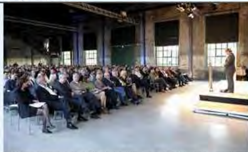
Großes Interesse: 350 Gäste kamen zur Preisverleihung in die Zeche Zollern nach Dortmund.

In Zeiten des demografischen Wandels, der Zunahme von Ein-Personen-Haushalten und der stellenweise noch ungeklärten Integration von Zugewanderten in die Wohnbevölkerung gewinnen aktive und gelebte Nachbarschaften immer mehr an Bedeutung. Lebendige Nachbarschaften bieten Einbindung und Geborgenheit, geben Sicherheit und praktische Hilfen für den Lebensalltag. "Lebendige Nachbarschaften - Wir in unserem Quartier" lautete der Titel des Auszeichnungsverfahrens, das die Architektenkammer und die Ministerien im Herbst 2008 ausgelobt hatten.