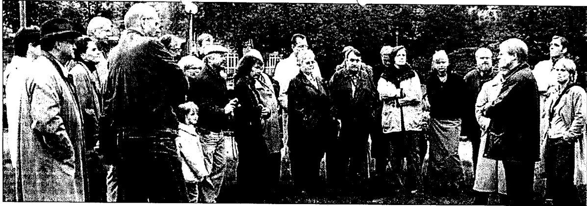
Unter dem Titel der NRW-weiten Aktion „Kunst trifft Stadt – Stadtbaukultur im Blick der Kunstvereine“ sollte auch in Ahlen ein anderer Blick auf Straßenkunst und Architektur geworfen werden. Zahlreiche Interessierte trafen sich am Samstag zu einem Spaziergang durch die City.