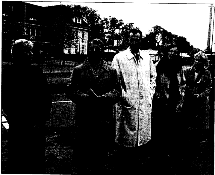
Die Kunst im öffentlichen Raum beschäftigte die Teilnehmer des Stadtspaziergangs, der vom Kunstverein veranstaltet wurde, am intensivsten.

Ähnliche Qualitäten bescheinigte Leismann auch der Arbeit des Japaners Shiro Matzui in der Südstraße mit dem Titel „What's behind the wall?“, ein Beitrag zur „Kunstspur“ des Kunstvereins aus Anlass seines 10-jährigen Bestehens. Demgegenüber entfalte die Stahlskulptur von Rolf Nolden eine raumgreifende Wirkung, die der gesamten städtebaulichen Situation am Bahnhof ihren Stempel aufdrücke. Das später angelegte Blumenbeet verträge sich eigentlich nicht mit der Arbeit, was den Künstler schon dazu veranlassen wollte, sie von diesem Ort wieder zu entfernen.