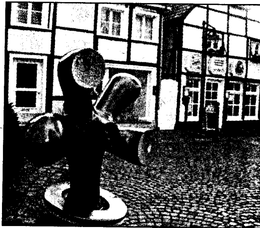
Die „Zauberblume“ von Otmar Alt gehört seit langem zum Bild in der Hellstraße.

Dazu hat sich der Kunstverein eine Route durch die Innenstadt ausgeguckt, die mit Kunstwerken gespickt ist. Treffpunkt ist um 15 Uhr am Bahnhof an der Skulptur „Intra - Extra“ von Rolf Nolden. Vorsitzender Walter Rinke freut sich auf spannende Diskussio-