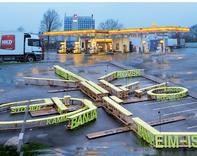
B1 | A40 – Die Schönheit der großen Straße