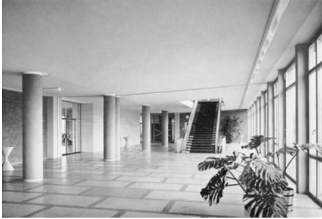
Foyer der alten Pädagogischen Hochschule Rheinland, heute Foyer der Humanwissenschaftlichen Fakultät der Universität zu Köln