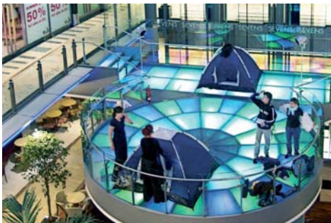
Nomad City Passage in Düsseldorf in 2007

Weitere Informationen unter >> www.jugend-architektur-stadt.de >> www.stadtbaukultur.nrw.de/projekte/NetzwerkBaukultur